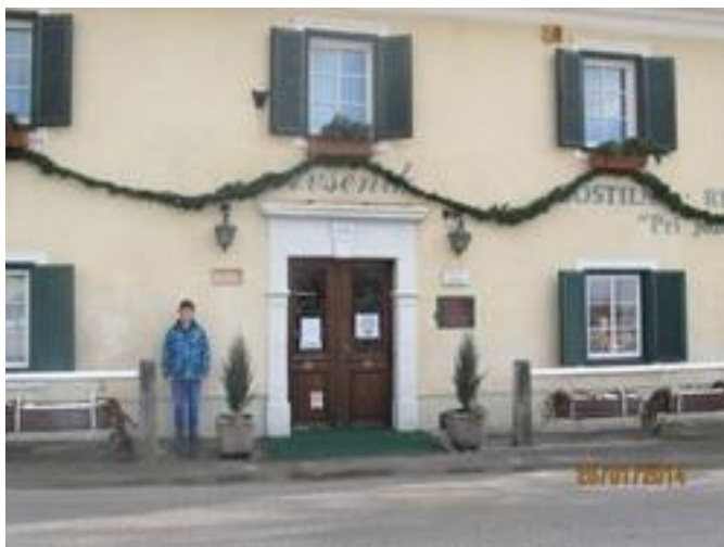
Begunje na Gorenjskem, 25.in 26.januar 2014